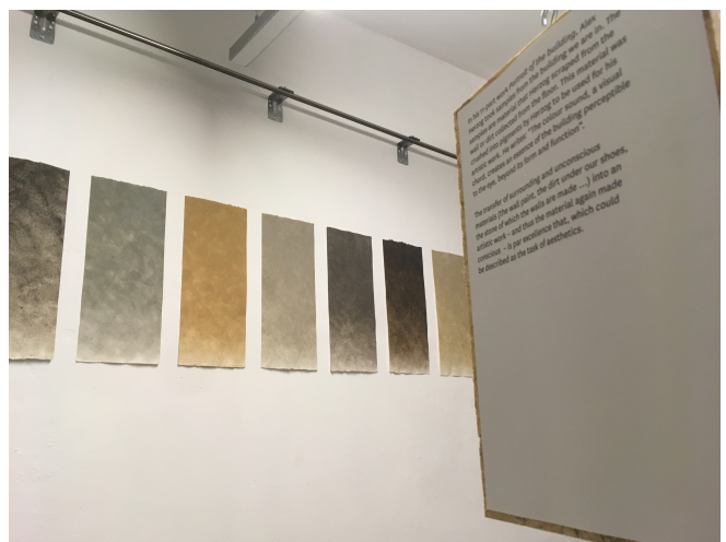
Immer wieder entstehen Verbindungen zwischen Text und Werk. Im Hintergrund die Arbeit «Portrait of the building» von Alex Herzog, Foto: Mathis Neuhaus