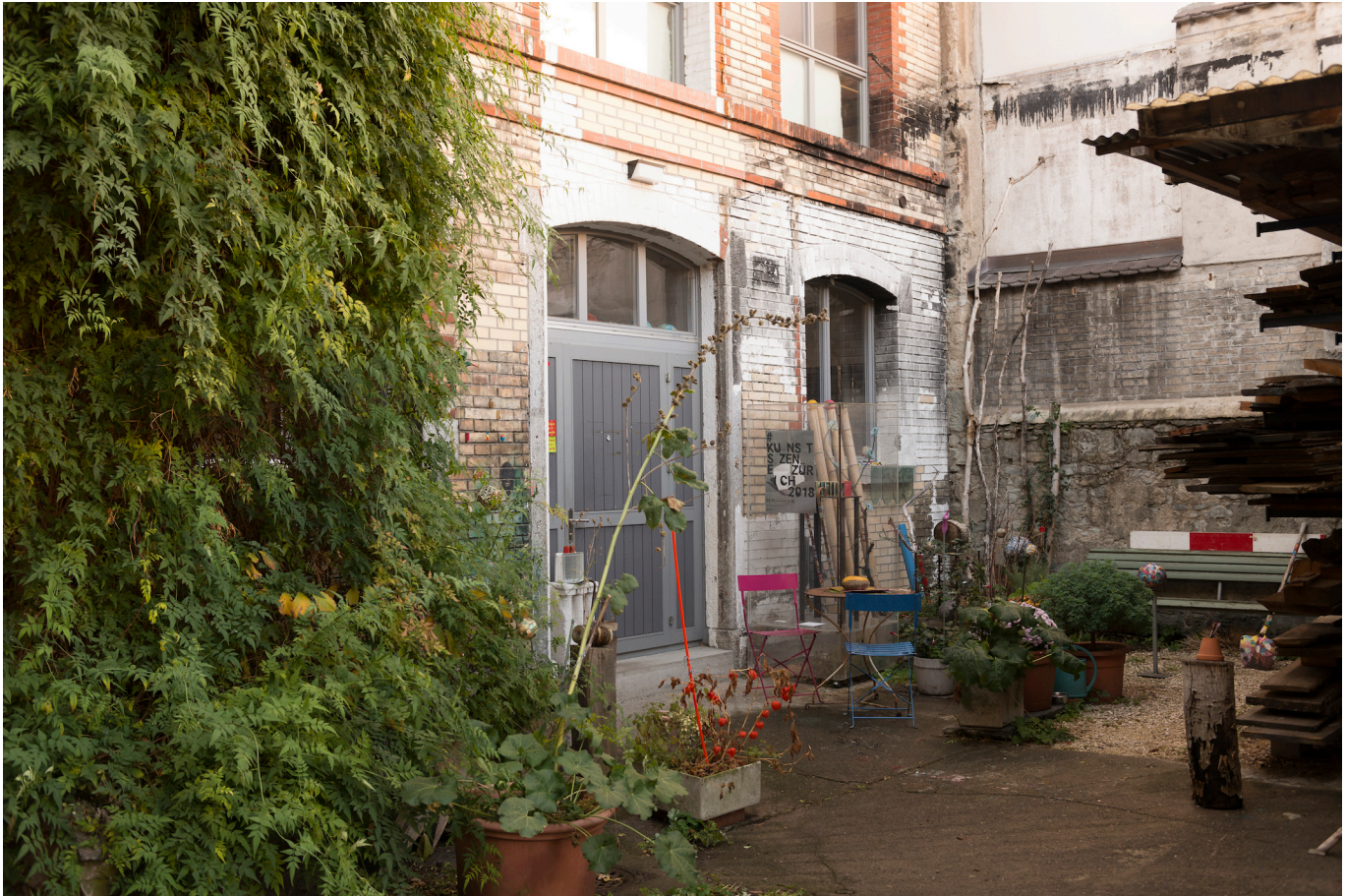
OnCurating Project Space, Foto: Dominik Zietlow

Zum Auftakt der Kunst: Szene Zürich 2018 gleich etwas Programmatisches. Im OnCurating Project Space am Sihlquai wird Kunst als ein Ensemble von vielfältigen individuellen Prozessen begriffen und behandelt. Das sorgfältige Kuratieren dieser verschiedenen Ansätze steht hier ganz oben auf dem Programm.